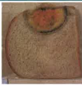
손 소독제를 사용하고 만진 빵