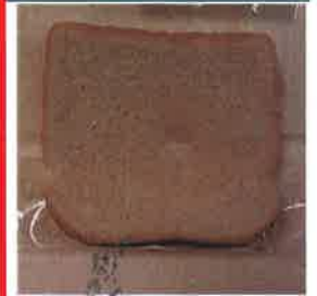
손을 대지 않은 빵