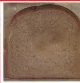
따뜻한 물과 비누로 손을 씻은 사람이 만진 빵