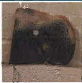
교육용 노트북에 문지른 빵