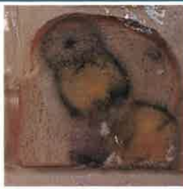
손을 씻지 않고 만진 빵